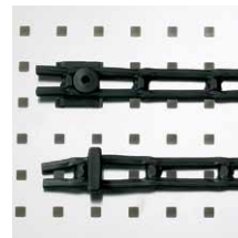
Ladderband 30 mm breed, met 2 bevestigingsdoppen, 1 m. Art.nr. 100985