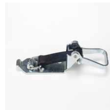
Spanvergrendeling Verzinkt staal Lengte rubberband 90 mm Art.nr. 100893