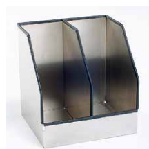
Ordnerhouder Aluminium, 2-vaks Art.nr. 100895