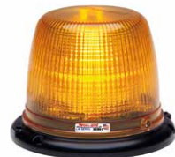
Leddaklamp ECE R65 Art.nr. 210-10-0172 optimale bedrijfsze- kerheid 5 jaar garantie op de ledunits