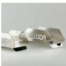
Aluminium slanghouders Slanghouder SH25 Breedte 250 mm Art.nr. 105614 Slanghouder SH32 Breedte 320 mm Art.nr. 105616