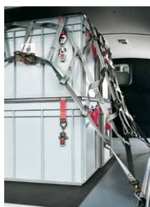
Ladingzekeringsnet 1200 x 1800 mm Rondom voorzien van bevestigingspunten voor trekbanden en haken. Art.nr. 101014