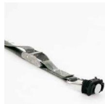
Spanband met fitting en gesp, 1 m. Art.nr. 100982 en gesp, 2 m. Art.nr. 100983