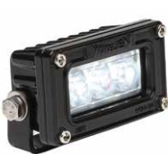
Ledwerklamp Art.nr. 210-99-0144 1100 LUMEN 5 jaar garantie op de ledunits