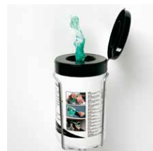
Vochtige reinigings- doekjes Inhoud 50 doekjes Art.nr. 100943 Wandhouder Art.nr. 100945