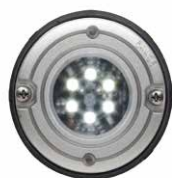
Ledinterieurverlichting Art.nr. 210-30-0307 360 lumen, aluminium basis 5 jaar garantie op de ledunits