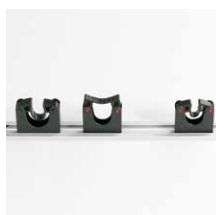
Gereedschapsklemmen Gereedschapsklem 20-30 mm Art.nr. 101048 Gereedschapsklem 30-40 mm Art.nr. 101049 Bevestigingsrail 500 mm Art.nr. 101050 Bevestigingsrail 900 mm Art.nr. 101051