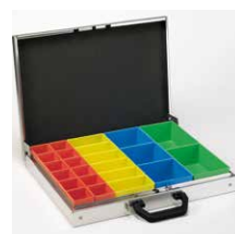
Aluminium koffer met inzetbakjes Indeling als afb. 1 Art.nr. 100921 Indeling als afb. 2 Art.nr. 100922 Indeling als afb. 3 Art.nr. 100923