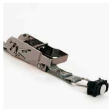
Spanband met fitting en ratelmechanisme, 1 m. Art.nr. 100979 en ratelmechanisme, 2 m Art.nr. 10 0980