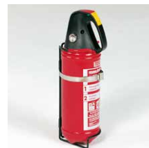
Brandblusser 2 kg Incl. wandhouder Art.nr. 100912

Kijk voor meer informatie op www.aluca.nl