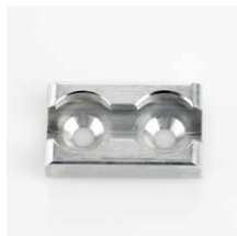
Vloeroog Geanodiseerd aluminium Art.nr. 106153