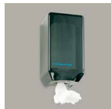
Papierrolhouder Art.nr. 100938 Navulling 9 papierrollen Art.nr. 100939